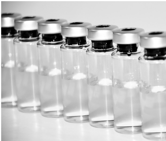
«Vaccination vaccination ampoule» Image réutilisable repérée à

Cet article, destiné aux infirmières vise à les sensibiliser sur l'importance de leur rôle dans la prévention de la santé par la promotion de la vaccination. Le manque d'adhérence de plusieurs personnes à se faire administrer certains vaccins a malheureusement fait réapparaître certaines maladies que l'on croyait éliminées. En 2011, le Québec a connu l'une des plus grandes épidémies de rougeole depuis les débuts de la vaccination en 1970 (MSSS, 2012). La réticence à se faire vacciner est souvent due à l'existence de mythes et à la désinformation qui influencent les gens et parfois même des professionnels de la santé. Cela peut avoir de graves conséquences sur la santé de la population.